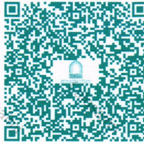
خطة البرامج التدريبية